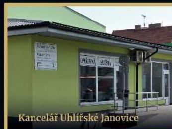
Kancelář Uhlířské Janovice