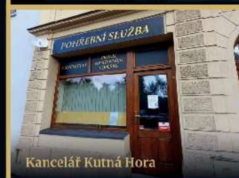
Kancelář Kutná Hora